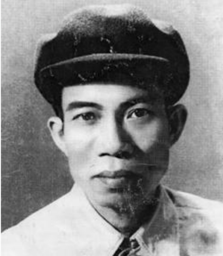
Nguyễn Bính (1918-1966)